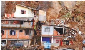
A justiça social é um princípio fundamental...

Alcançar a justiça social no mundo é um passo fundamental para a realização de objetivos cruciais. É isso significar lutar pela defesa de direitos e oportunidades para todos as pessoas levando em conta os diferentes contextos e realidades em que elas estão inseridas. Para assegurar a estabilidade e a prosperidade, é preciso garantir a todos um nível de vida aceitável e oportunidades iguais. A miséria, a fome, a discriminação e a negação dos direitos humanos ainda continuam marcando o nosso panorama moral.