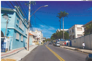
A Rua Ponte Nova acompanhou o desenvolvimento da capital mineira

...Ponte Nova que está localizada na região nordeste de Belo Horizonte, dentro dos limites do Bairro Floresta. A história desse logradouro se confunde com a própria história de Belo Horizonte pelo fato de ter sido um dos primeiros bairros a surgir na capital. Nessa via pública se encontra serviços, escola, igreja e uma intensa rede de comércio. Além, dos moradores e residências que ajudam a contar a história de nossa cidade.