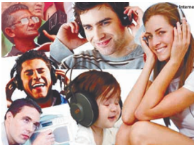
Sintonize seu rádio e fique bem informado