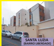
SANTA LUZIA (BAIRRO LIBERDADE)

Apto 2 qts com garagem, próximo Shopping Estação - 170 mil