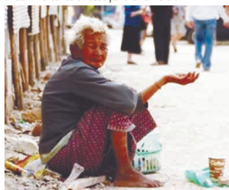
... e um sonho difícil para grande parte da humanidade

O Brasil consta na lista de países com mais desigualdades entre pobres e ricos, segundo pesquisas e esse dado confirma a existência no país de uma grande injustiça social. Toda a sociedade, governos e políticos precisam colocar em prática ações de defesa e promoção da vida digna para todos os brasileiros buscando um novo desenvolvimento, mais solidário, mais sustentável e com participação equi-