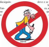
Quem bebe com moderação, não tem ressaca!

e excesso de cafeína. Coma grãos integrais, frutas e hortaliças. Não é verdade que ressaca se cura com mais álcool. É, se beber demais mesmo, a saída para evitar os efeitos ainda mais graves de uma intoxicação por álcool é o pronto-socorro. Agora que você já sabe o que fazer quando estiver de ressaca, aproveite as suas noites. Mas com muito juízo! Bebida Alcoólica e direção não combinam. Se for beber vai de táxi, de carona ou a pé.