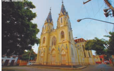
Igreja Matriz de São Sebastião - Ponte Nova/ MG

semeiros ajudaram a expandir o desenvolvimento regional.